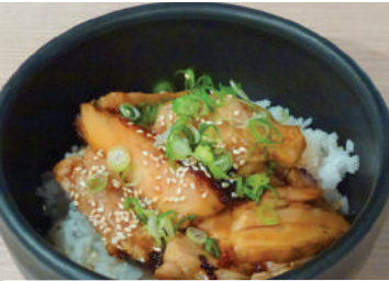
Teriyaki Chicken Don