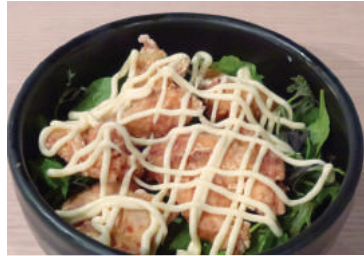
Deep Fried Chicken Don