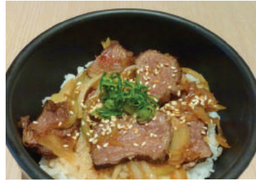
Ginger Beef Don