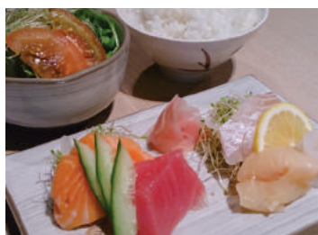
Mix Sashimi Set