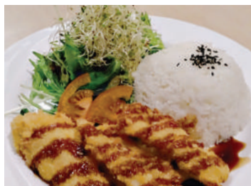
Crumbed Chicken Set