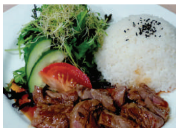
Beef Teriyaki Set