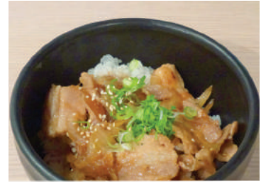
Ginger Pork Don