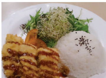
Crumbed Fish Set